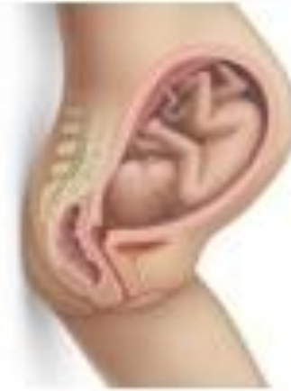
1. Head Engaged