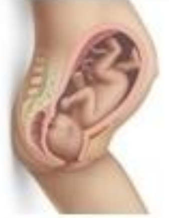
2. Head Crowning